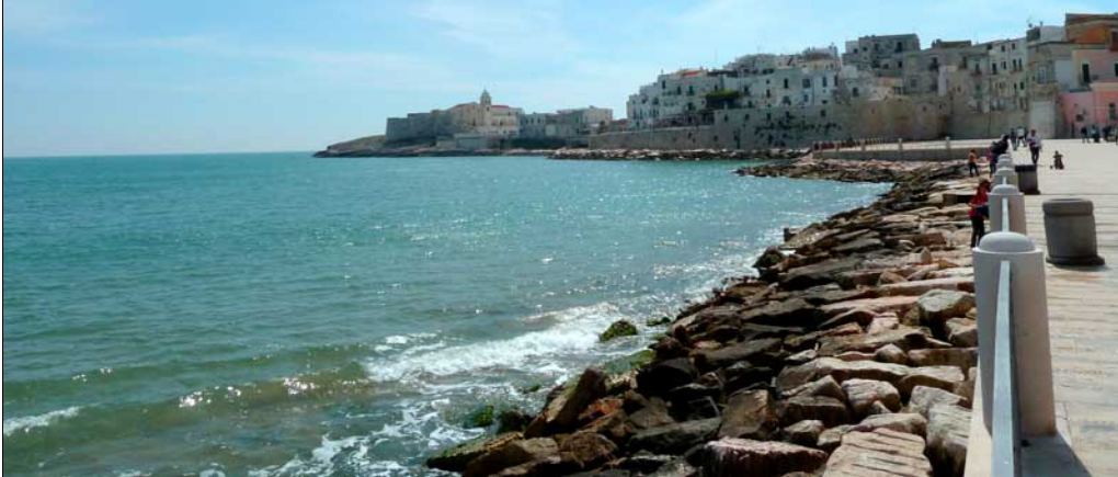
Vieste stazione meteo a cura di Giulio Calderisi